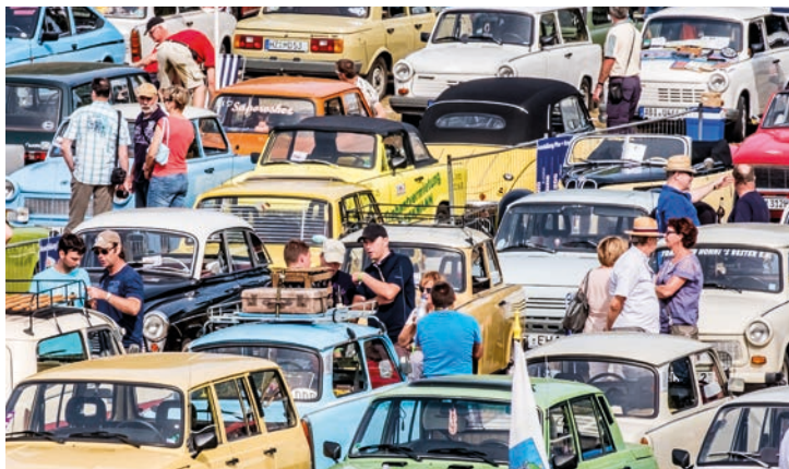
26. August OMMMA - Ost-Mobil-Meeting Magdeburg