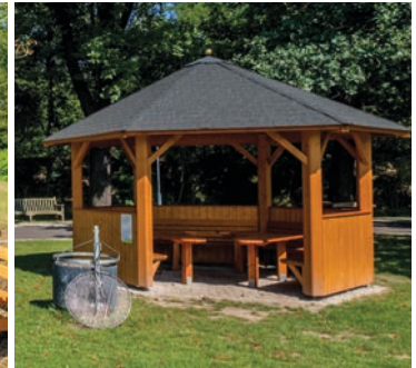
Grillplatz am Sportareal