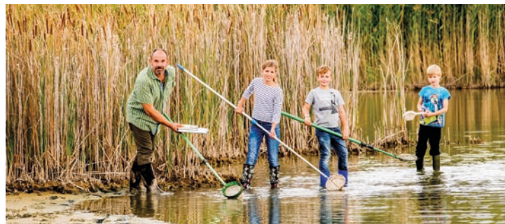
Sommerferien in LSA dienstags und mittwochs Ferienspaß

MMA-BOXSPORT-EVENT IN FREILICHTKULISSE ORT: SEEBÜHNE 26 | VERANSTALTER: CROWD EVENT GMBH