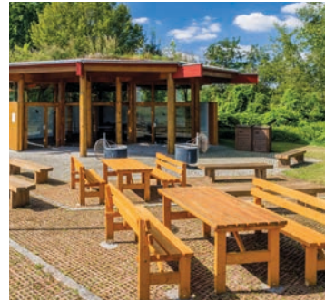
Grillplatz mit Gartenhaus

Wenn die Temperaturen draußen nach oben klettern, werden überall die Grills angeheizt. Auch bei uns im Elbuenpark. Wer leckere Würstchen frisch vom Grill genießen möchte, kann einen unserer fest installierten Grillplätze am Sportareal, am Kletterpark sowie das malerische Gartenhaus mit seinem angeschlossenen Grillplatz nutzen. Dazu stehen von April bis Oktober täglich ab 10 Uhr bis zum Einbruch der Dunkelheit unsere Grillplätze offen. Also Grillkohle, Bratwürste, Steaks und Getränke eingepackt und auf in den Park! Für den Transport aller Zutaten verleihen wir gern einen unserer Bollerwagen gegen Gebühr. Reservieren können Sie den Platz am Grill über unsere Internetseite oder per Telefon bis drei Tage vor dem Grilltermin. 55